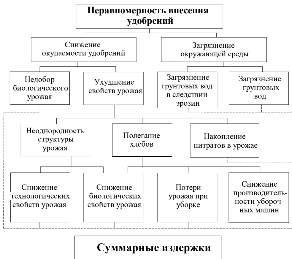
Рис. 1. Структурная схема издержек от некачественного внесения удобрений.

Поэтому исследования посвященные совершенствованию технологического оборудования весьма актуальны и направлены на увеличение производительности машин, возможности адаптации их к условиям работы (в зависимости от состава удобрений), снижение повреждения удобрений, а также на универсализацию данных машин.