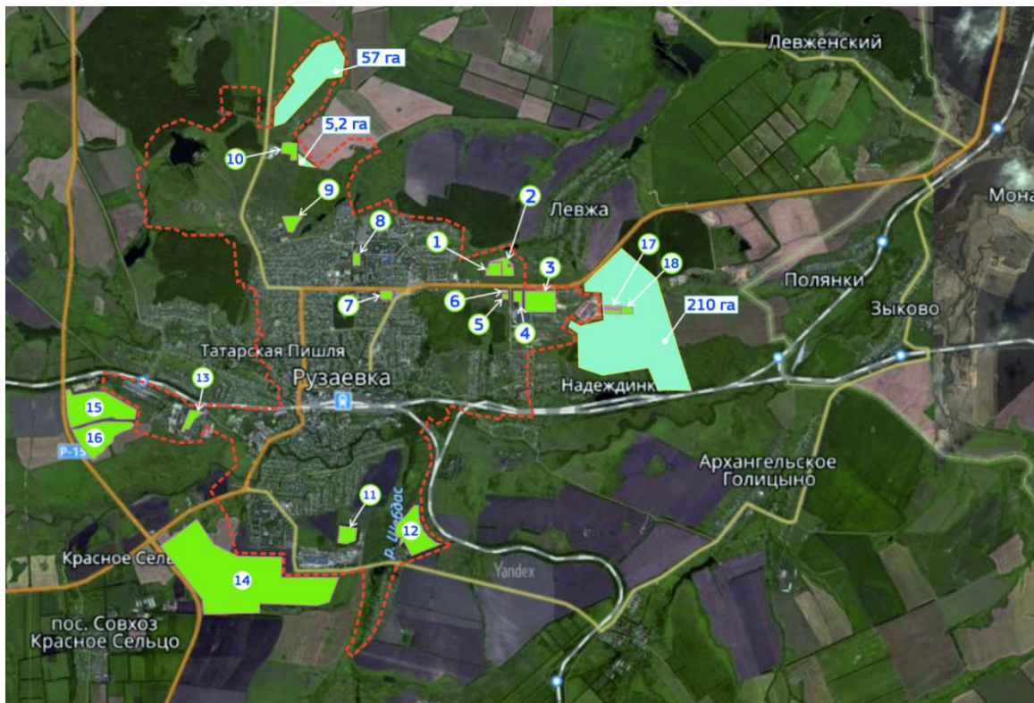
Рис. 1. Инвестиционные производственные площадки на ТООСЭР «Рузаевка».

имеющихся работающих или ранее функционировавших производств, в целях их модернизации или восстановления деятельности. К таким производствам относится ОАО «Рузаевский завод листоштамповочных автоматических линий» (ЛАЛ).