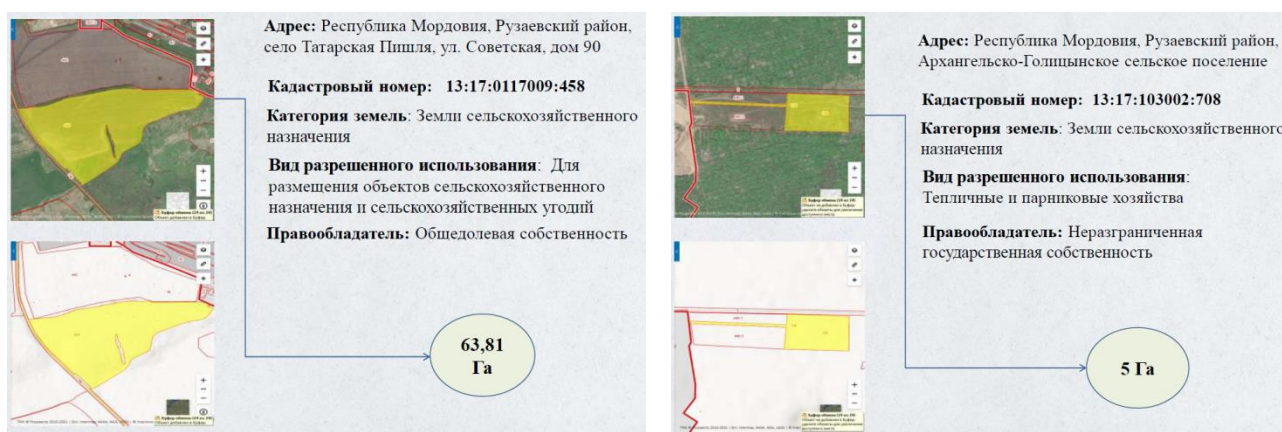
Рис. 3. Инвестиционные площадки № 15 и № 16.

4) ИП в районе Рузаевского кирпичного завода (площадка № 16) (см. рис. 3). Местоположение: РМ, Рузаевский муниципальный район, Архангельско-Голицынкское сельское поселение; площадь 6 га; категория земель: земли сельхозназначения; вид разрешенного использования: для размещения зданий, строений, сооружений для производства, хранения и первичной переработки сельскохозяйственной продукции; КН 13:17:01030 02:690 (см. рис. 3);