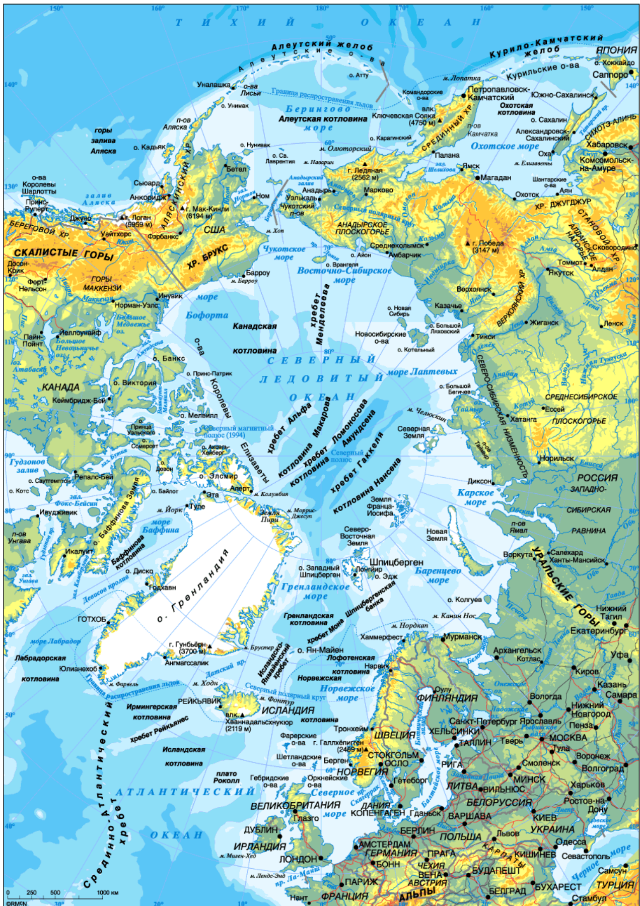
Рис. 1. Карта Северного Ледовитого океана [11; 13].