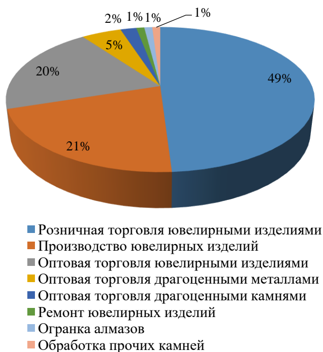
Рис. 1. Виды деятельности в ювелирной отрасли России на 2020 год [составлено по источнику 6].

чем в сфере производства. Связано это с наличием крупных монополистских предприятий в сфере добычи и производства.