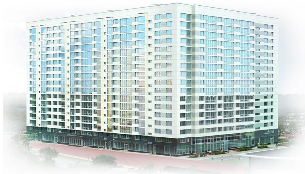
Рис. 1. Реализация трехмерного моделирования здания в Revit Architecture.

Компания Autodesk выпустила три версии Revit для разных задач проектирования зданий: Revit Architecture – для архитекторов и дизайнеров; Revit Structure – для разработки несущих конструкций; Revit MEP – для разработки решения инженерных систем электроснабжения, вентиляции и водоснабжения. Возможность 3D-моделирования позволяет воплощать индивидуальные идеи каждого (см. рис. 1).