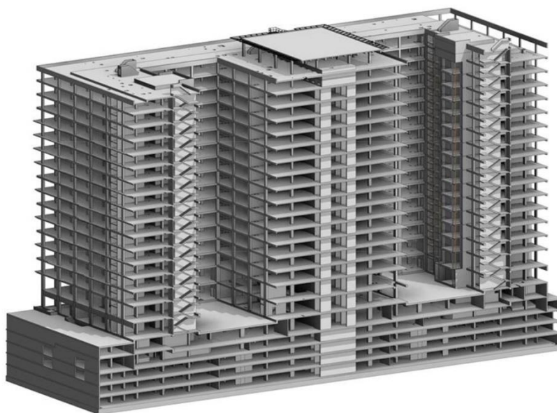
Рис. 2. 3D-модель конструктивной системы здания в Revit Structure.

База данных Revit содержит всю необходимую информацию о проекте на разных этапах проектирования здания, от разработки концепции до строительства и его демонтажа. Трехмерная модель здания делится на рабочие плоскости, что дает возможность рассмотреть все важные конструктивные элементы (фундаменты, колонны, стены, перекрытия). Все составляющие детали доступны в семействах, которые загружаются из стандартных библиотек [4]. Также есть возможность разработки пользовательских семейств и их распространение. На примере трехмерной модели доступно изучение влияния разных элементов сооружения на наглядность перспективного изображения (см. рис. 2).