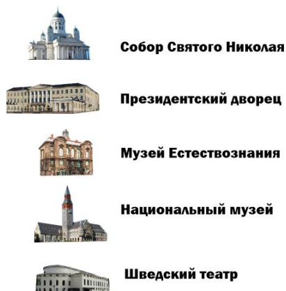
Рис.1. Условные обозначения для карт-схем на примере г. Хельсинки

интернет-ресурсов. Из множества предлагаемых изображений отбирались самые яркие, четкие и понятные. Созданные таким образом условные обозначения представлены на рисунке 1.