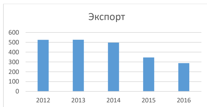
Рис.3. Динамика экспорта в России за 2012 – 2016 гг. (млрд. долл. США).

В 2014 году экспорт России также существенно сократился (рис. 3). По данным ФТС России, снижение экспорта произошло на 5,8% и составило 496,9 млрд. долл. США [5]. В 2015 году экспорт России продолжил динамику сокращения и к концу года составил 345,9 млрд. долл. США, снизившись по сравнению с 2014 годом на 31,1% [6]. В 2016 году экспорт составил 287,6 млрд. долл. США и по сравнению с 2015 годом снизился на 17,0%. Основой российского экспорта в 2016 году в страны дальнего зарубежья традиционно являлись топливно-энергетические товары, удельный вес которых в товарной структуре экспорта в эти страны составил 62,0% (в 2015 году – 66,5%). По сравнению с 2015 годом стоимостный объем топливно-энергетических товаров снизился на 22,5%, а физический – возрос на 3,2%. При этом возросли физические объемы экспорта газа природного на 13,8%, угля каменного – на 9,1%, нефти сырой – на 6,6% [7].