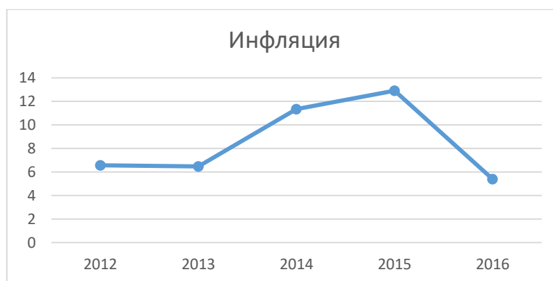
Рис. 1. Динамика уровня инфляции России за 2014 – 2016 гг. (в %).

Уровень инфляции в 2016 году составил 5,39% [4]. К причинам низкой инфляции в указанном периоде можно отнести падение доходов населения и сокращение ВВП страны. Однако инфляционные риски сохраняются, на фоне экономической неопределенности инфляционные ожидания населения остаются повышенными.