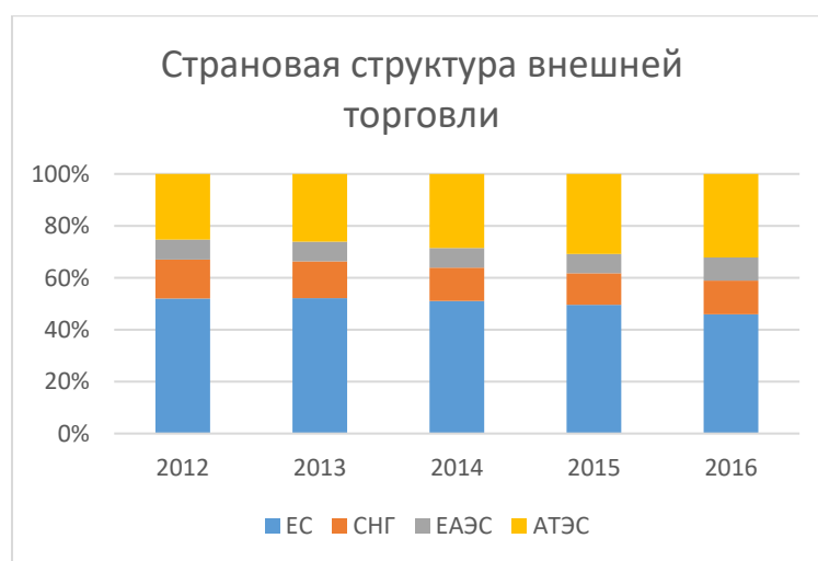
Рис. 5. Страновая структура внешней торговли России 2012 – 2016 гг. (в %).

Страновая структура внешней торговли (рис. 5) показывает, что на долю Европейского Союза (ЕС) в 2014 году приходилось 48,2% российского товарооборота (в 2013 г. – 49,6%); на страны СНГ – 12,2% (13,4%), на страны ЕАЭС – 7,1% (7,2%), на страны АТЭС – 27,0% (24,8%) [5]. В 2015 году на долю ЕС приходилось 44,8% российского товарооборота, на страны СНГ – 12,5%, на страны ЕАЭС – 7,8%, на страны АТЭС – 28,1% [6]. В 2016 году на долю ЕС приходилось 42,8% российского товарооборота (в 2015 г. – 44,8%), на страны СНГ – 12,1% (12,6%), на страны ЕАЭС – 8,3% (8,1%), на страны АТЭС – 30,0% (28,1%) [7]. Таким образом, доля российского товарооборота с ЕС сокращается. Между тем наблюдается положительная тенденция для нашей страны, а именно увеличение объема внешней торговли со странами ЕАЭС и АТЭС.