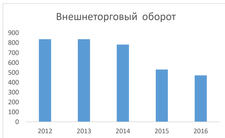
Рис. 4. Динамика внешнеторгового оборота в России за 2012 – 2016 гг. (млрд. долл. США).

В 2016 году внешнеторговый оборот России составил 471,2 млрд. долл. США и по сравнению с 2015 годом снизился на 11,2% [7].