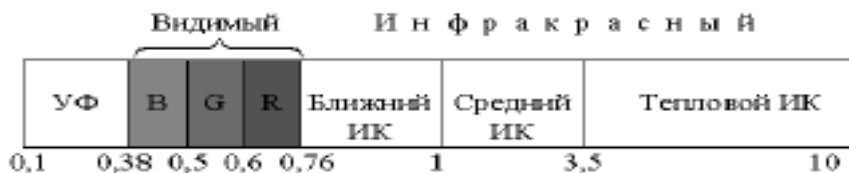
Рис. 1. Оптический диапазон электромагнитных волн.

При дистанционном зондировании Земли из космоса используется оптический диапазон электромагнитных волн и микроволновый участок радиодиапазона. На рисунке 1 представлен оптический диапазон, включающий в себя ультрафиолетовый (УФ) участок спектра, видимый участок – синяя полоса (В), зеленая (G), красная (R); инфракрасный участок (ИК) – ближний ИК (БИК), средний ИК и тепловой ИК, а также его место в спектре электромагнитных волн.