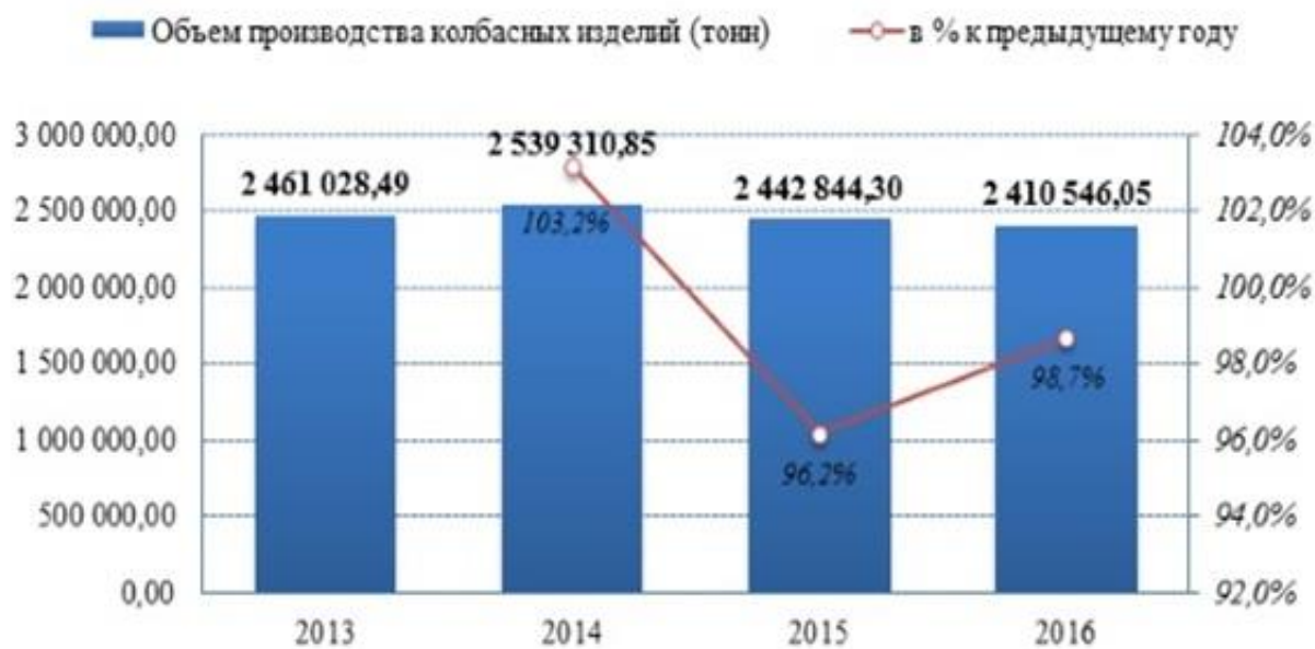
Рис. 1. Динамика объема российского производства колбасных изделий в 2013–2016 гг., тонн.

По оценкам Alto Consulting Group, в 2016 году наибольший объем выпуска продукции был отмечен в ноябре и составил 8,2% по отношению к аналогичному месяцу 2015 года. При этом крупнейшие объемы производства колбасных изделий в нашей стране были обеспечены предприятиями Центрального федерального округа. На 476,8 тыс. тонн меньше составил объем выпуска данной категории товара в Приволжском федеральном округе. Если рассматривать структуру производства, на протяжении последних четырех лет в данном сегменте рынка лидером остаются фаршированные колбасные изделия, производство которых в 2016 году составило 1 538,9 тыс. тонн с долей 63,8% от общего объема выпущенных предприятиями колбасных изделий [1].