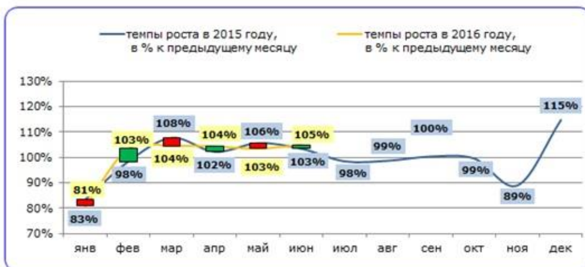
Рис. 2. Динамика производства колбасных изделий в РФ в январе 2015 – июне 2016 гг., в % к предыдущему месяцу в натуральном выражении.