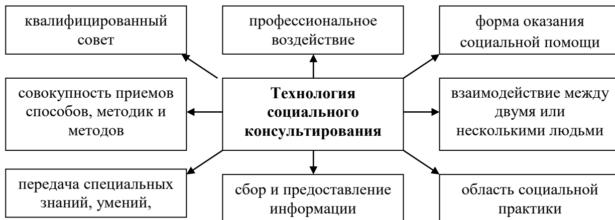
Рис. 1. Составляющие технологии социального консультирования.

а консультант создает условия, которые поощряют автономное и компетентное, осознанное поведение клиента (человека или группы); 5) сердцевиной консультирования является «консультативное взаимодействие» между клиентом и консультантом, основанное на более или менее общепринятых постулатах помощи (см. рис. 1).