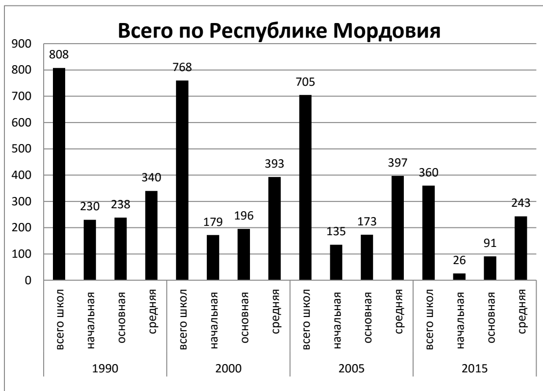
Рис. 1. Динамика общего числа школ Республики Мордовия [2].

Как видно из рисунка 1, общее число школ постоянно уменьшается. Так, в период с 1990 по 2015 гг. количество школ сократилось на 448, что составляет около 65% от числа школ, функционирующих на сегодняшний момент. Резкое уменьшение количества школ начинается после 2005 г. Так, если за 15 лет, начиная с 1990 г., общее количество школ сократилось на 103, то с 2005 по 2015 гг. это сокращение увеличивается почти в половину – на 365 школ.