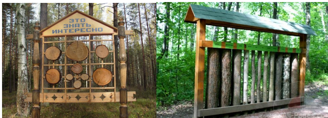
Рис. 3. «Говорящие кольца жизни».

2. «Говорящие кольца жизни» – это стенд, на котором помещены спилы стволов деревьев с табличками, содержащими их названия. По годичным кольцам можно определить годы жизни дерева. Одно кольцо – один год жизни. Ширина годичных колец у дерева меняется год от года, поэтому совокупность всех колец – это летопись, по которой можно прочитать очень многое: возраст, температурные колебания воздуха, количество осадков, нашествие вредителей, лесные пожары (см. рис. 3).