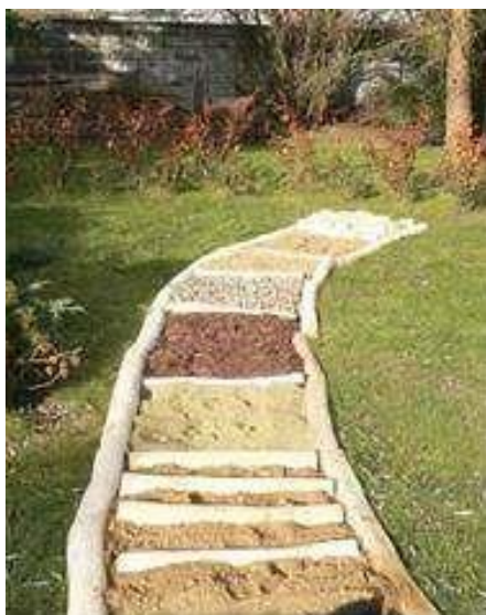
Рис. 2. «Тропа чувств».

желанию с закрытыми глазами (см. рис. 2). Это необычный способ знакомства с окружающим миром;