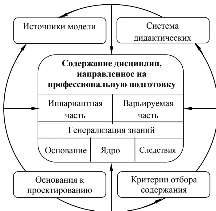
Рис. 1. Проектирование содержания магистерской подготовки.

Содержательный компонент (см. рис. 1) состоит из фундаментальных законов, понятий, научно-технических теорий, формируемых при обучении естественно-научным, общепрофессиональным, специальным дисциплинам, профессионально направленным на решение проблем инженерных специальностей, а также законов развития техники, методов инженерного творчества и методов его интенсификации, положений законодательных и нормативных [1]. Этот компонент базируется на общедидактических и частно-дидактических принципах, а также соответствующих им критериях отбора учебного материала.