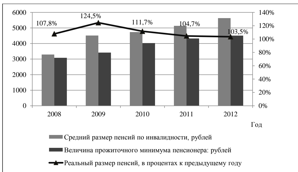
Рисунок 3. Средний размер назначенных месячных пенсий по инвалидности.

Основным источником доходов инвалидов в Российской Федерации является пенсия. Однако её размер настолько мал, что для нормальной жизнедеятельности инвалидов пенсии зачастую недостаточно. Средний размер назначенных пенсий инвалидов представлен на рисунке 3.