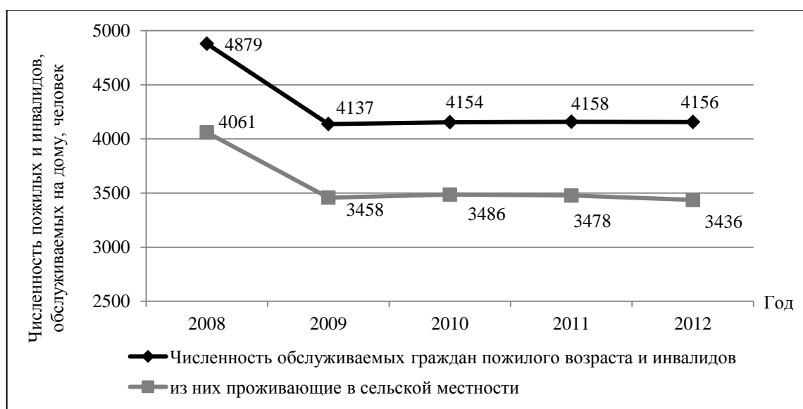
Рисунок 4. Численность пожилых и инвалидов, обслуживаемых на дому в 2008 – 2012 гг., человек.

В связи с нарушениями здоровья инвалидов и необходимостью постоянного ухода за ними законодательством предусмотрена социальная помощь данной категории населения на дому. Численность пожилых людей и инвалидов, которым в 2008–2012 гг. была предусмотрена социальная помощь на дому, представлена на рисунке 4.