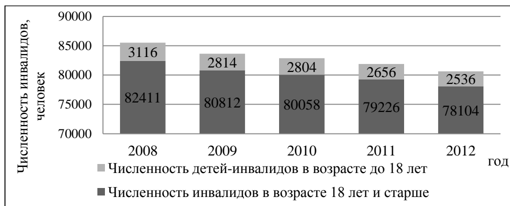
Рисунок 1. Численность инвалидов в 2008 – 2012 гг.

Проанализируем социально-экономическое положение инвалидов на примере Республики Мордовия. Численность инвалидов в регионе представлена на рисунке 1.