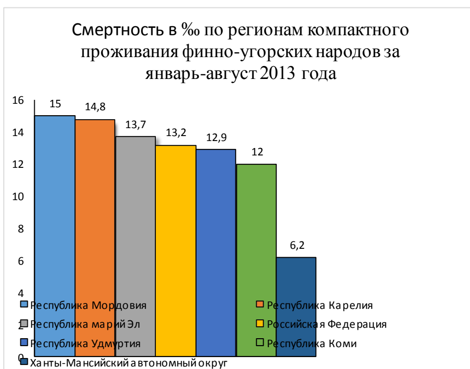
Рис. 2 Смертность в регионах компактного проживания финно-угорских народов России

Коэффициент смертности, напротив, вырос в республиках Марий Эл (на 0,1 ‰), Мордовия (на 0,6 ‰) и Удмуртия (на 0,2 ‰). В Республике Карелия он снизился на 0,5 ‰, Республике Коми и Ханты-Мансийском автономном округе – на 0,2 ‰ (рис. 2).