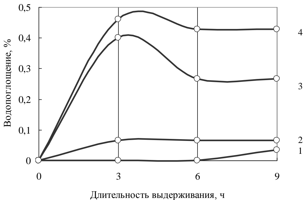
Рис. 3. Зависимость изменения водопоглощения наполненных эпоксидных композитов после выдерживания образцов в воде при t=80\text{ }^{\circ}\text{C} от содержания биоцидной добавки «Тефлекс» (обозначения те же, что и на рис. 1)