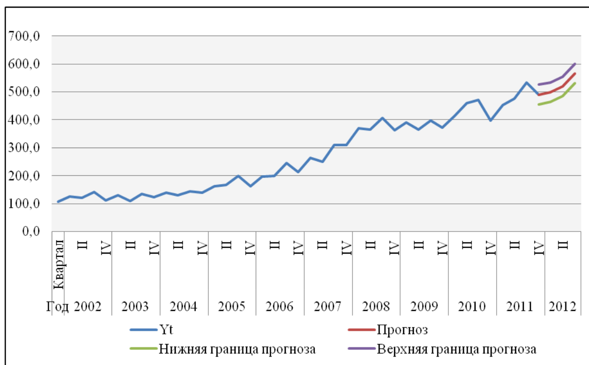
Рисунок 2 – Прогноз оборота общественного питания в РМ на 2012 г. на основе адаптивной модели Хольта -Уинтерса, млн. руб.

В работе осуществлено прогнозирование величины оборота общественного питания в Республике Мордовия с помощью различных методов: аналитическое выравнивание по кривым роста, тренд–сезонные модели, модель Хольта–Уинтерса, сезонная ARIMA – модель. В результате получено, что наилучшей прогнозной моделью является, адаптивная модель Хольта – Уинтерса.(рисунок 2).