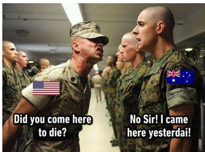
Рис. 1. Интернет-мем № 1.

Комичность ситуации во многих англоязычных интернет-мемах может быть создана с помощью фонетической языковой игры, то есть игры на созвучии. В интернет-пространстве наиболее частотными являются мемы, в которых сравниваются американский и британский английский. Вызывает интерес пример различия в произношении австралийского от привычного нам американского английского (рис. 1). Солдат владеющий американским английским спрашивает другого “Did you come here to die?” (пер. Ты пришел сюда умереть?), на что австралиец отвечает “No Sir! I came here yesterday!” (пер. Нет, Сэр! Я пришел сюда вчера!). Недопонимание происходит на почве специфики характерного произношения двух видов диалекта английского языка. Американская речь характеризуется небрежностью и резкостью, а также является сама по себе очень импульсивной и быстрой – отсюда американцы часто проглатывают конец слов или предложений. В это же время, австралийцы очень спокойны во время разговора и предпочитают мелодичность речи. Поэтому австралийский солдат вместо нужного «to die» (умереть), услышал «today», что переводится как «сегодня». Именно фонетические особенности диалектов, основанные на различиях акцентов английского, сделали эту ситуацию комичной.