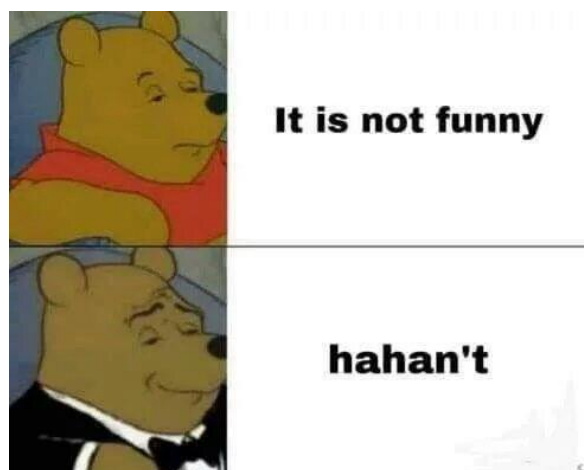
Рис. 2. Интернет-мем № 2.

Интерес вызывает интернет-мем основанный на грамматическом аспекте языка (рис. 2). В первую очередь нужно выделить визуальную часть мема: нам представлен вид мема, где картинка представляет собой шаблон. На картинках изображен Винни-Пух, однако на каждой он представляется нам в разном облики. На первой картине медведь показан в привычном нам виде, соответственно, отражая обыденность и естественное положение вещей. На втором изображении нам представлен Винни-Пух в смокинге, отражая элитарность и свое интеллектуальное превосходство. Обращаясь к грамматике английского языка, мы знаем, что отрицательная форма вспомогательного глагола формируется с помощью прибавления к начальной форме глагола частички «not» или же её сокращение «n't». Таким образом, в обычной жизни мы бы ответили, как первый Винни-Пух – “It is not funny” (пер. Это не смешно), но если бы мы хотели выразиться более «остроумно», то вероятно сказали бы как второй медведь – “hahan't”. Таким ответом мы «отрицаем» смех, добавляя к нему частичку «not» в сокращенном варианте, придавая ситуации ироничный оттенок.