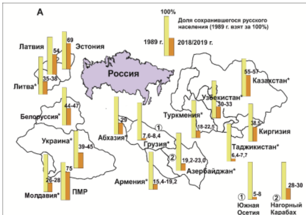
Рис. 2. Доля сохранившегося русского населения в постсоветских странах (1989 г. взят за 100%).

сих пор не столкнулось с большими демографическими проблемами, благодаря иммигрантам. Важно понимать, что эти «людские запасы», которые мы получаем ежегодно, уже очень скоро закончатся и нам нечем будет восполнять естественную убыль населения. Если имеющаяся тенденция в изменении численности населения не изменится, то в ближайшее время страна столкнется с глубоким демографическим кризисом. На рис. 2 видно, что показатели русского населения, проживающего за рубежом, истощаются и в ближайшем будущем России неоткуда будет восполнять свои людские ресурсы.