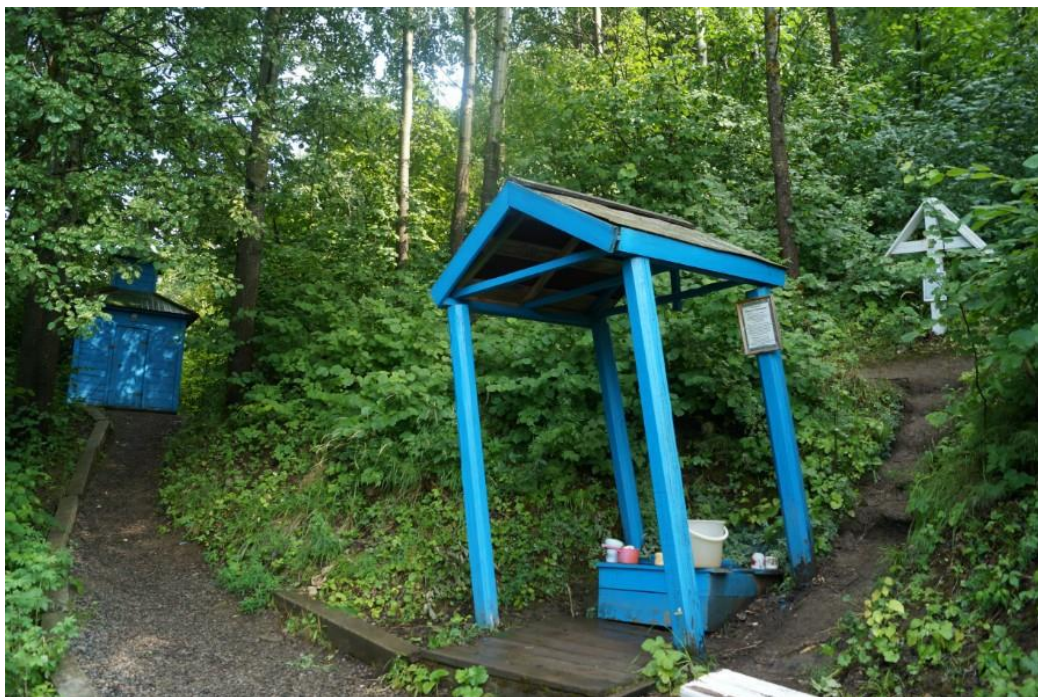
Рис. 2. Источник Николая Чудотворца.

Следующим объектом туристического маршрута может стать Спасо-Преображенская пустынь «Старцев угол», представляющая собой одну из святынь православия [6]. Данная местность овеяна легендами и имеет давнюю историю, связанную с военным походом царя Ивана Васильевича на Казань и явлением к нему в это время чудотворца Спиридона Тримифунтского. На территории «Старцева угла» находится 3 источника: источник Николая Чудотворца (рис. 2.), источник чудотворца Спиридона Тримифунтского и Спасов источник. История появления источников описана еще в летописях Почаевской Лавры. В настоящее время это место пользуется популярностью у людей с трудными жизненными ситуациями, желающими уединения, тишины и спокойствия.