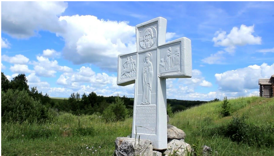
Рис. 3. Крест, воздвигнутый в честь явления Ивану Грозному чудотворца Спиридона Тримифунтского.

Помимо уже имеющихся святынь на территории пустыни возводится монастырь. После освящения монастыря это место получило новое название «Архиерейское подворье Свято-Преображенской Спиридоновой пустыни».