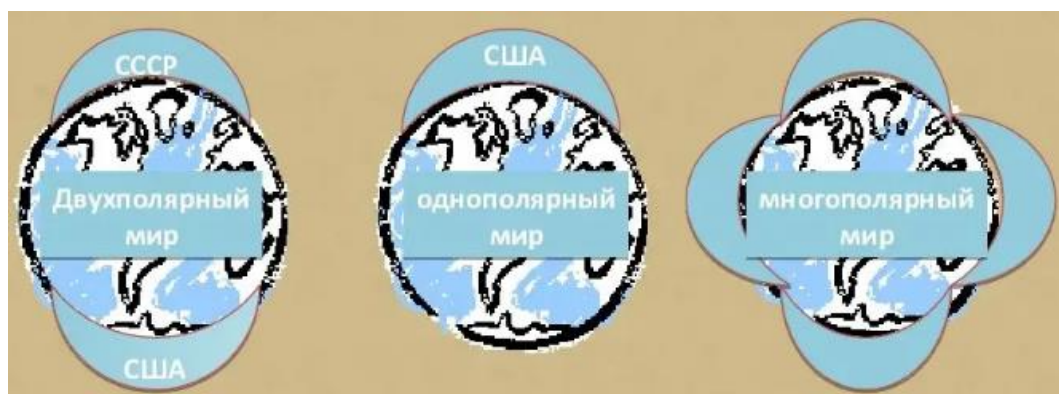
Рис. 1. Схемы полярностей [3].

Полярность в международной системе определяется за счет распределения власти и потенциала. Если на международной арене один лидер, то устройство считается монополярным, при двух – биполярным, а если более – то многополярным (рисунок 1).