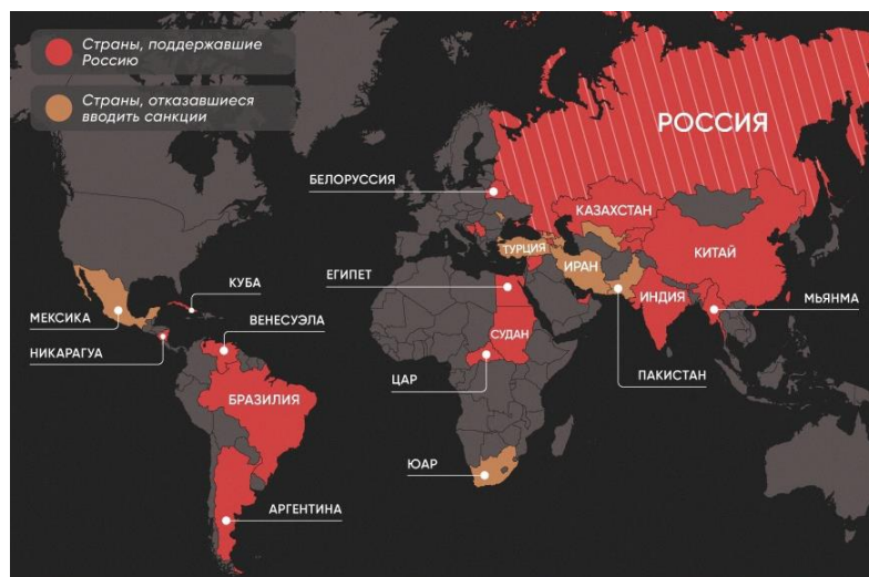
Рис. 5. Страны, поддержавшие Россию и/или отказавшиеся вводить санкции [11].

Поддержка со стороны таких держав как Китай и Индия, потенциальных мировых полюсов силы, имеет гораздо больший вес, чем все западные ограничения, что ещё раз доказывает, что монополярная система «дала сбой». Кроме того, пока США всеми силами пытаются устранить Россию, выделяя крупные суммы на оружие Киеву, они рискуют отдать статус «первой экономики мира» КНР. Китайская экономика восстанавливается гораздо быстрее американской, кроме того, политика Китая в сфере внешней торговли является весьма эффективной и может быть использована в качестве примера государствами, которые хотят увеличить объемы экспорта и развить внешнеторговые связи. Если такая тенденция продолжится, в недалеком будущем Китай, вероятнее всего, станет одним из главных центров силы.