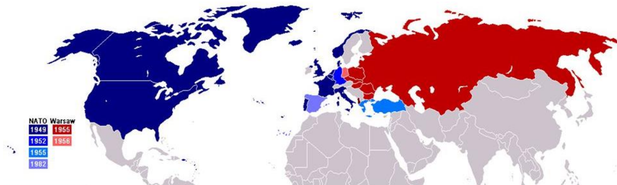
Рис. 2. Страны, входящие в НАТО и ОВД до 1990–х гг.

Понятие полярности мира появилось во время «холодной войны». В начале века мир был признан биполярным и разделён на Запад и Восток. На тот момент сверхдержавами считались США и СССР, а остальные как бы были полем их игры (союзники США – НАТО, СССР – Организация Варшавского Договора) (рисунок 2). Уходя на более чем полутора веков в историю, это вечное сопротивление имеет под собой глубокие корни.