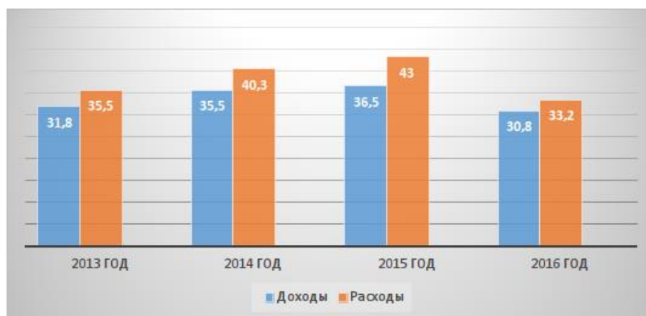
Рис. 3. Соотношение доходов и расходов бюджета Республики Мордовия за период 2014–2016 гг.

В рассматриваемый промежуток времени бюджетная политика Республики Мордовия сосредоточена на социальной и экономической сферах. Важнейшим направлением стала социальная политика региона. Исходя из состава расходов республиканского бюджета, мы делаем вывод, что самыми объемными являются расходы на образование, социальную политику, здравоохранение. Большая часть бюджета уходит на поддержание национальной экономики. Это происходит из-за реализации стратегических приоритетов экономического развития. В 2016 году резко падают траты на национальную экономику, охрану окружающей среды, культуру, физическую культуру и спорт.