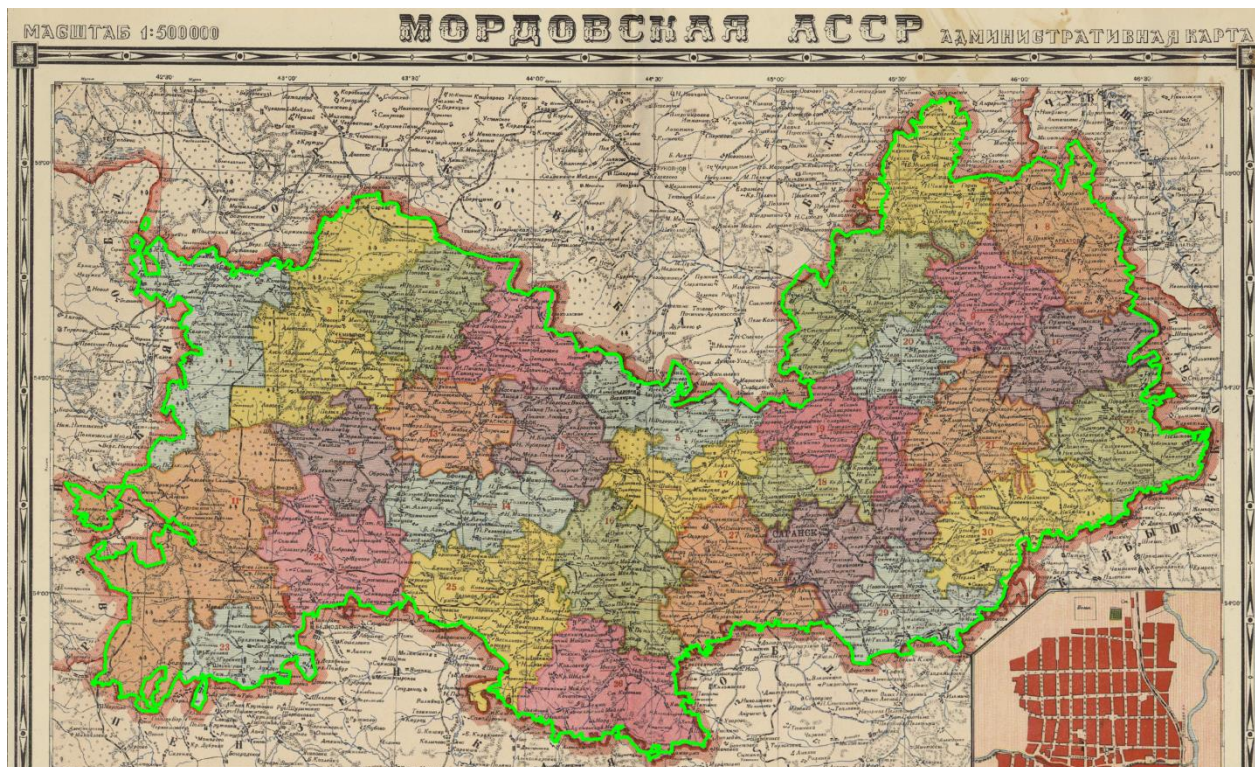
Рис. 1. Современная граница Республики Мордовия (показана зеленым цветом) на уменьшенной карте МАССР 1939 г.

современной границы Республики Мордовия (см. рис. 1). Затем проводился анализ местоположения трансформированных участков границы с привлечением карт, изданных позднее, и справочной литературы. В качестве примера проследим по картографическим источникам историю изменения небольшого участка южной границы республики с Пензенской областью.