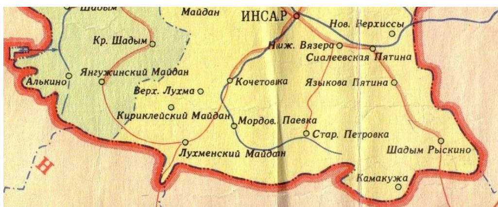
Рис. 4. Тот же (см. рис. 2, 3) участок административной границы на карте МАССР 1966 г.

Карта Мордовской АССР масштаба 1:600 000 1966 г. издания по сравнению с предыдущими картами составлена с большим обобщением административной границы (см. рис. 4). Но на ней показана часть, отделенная от основной территории (эксклав), появившаяся вследствие уточнения границы между МАССР и Пензенской областью. Нами был проведен анализ местоположения этого участка границы на современных и старых топографических картах. Оказалось, что на этой территории размещался пос. Ягодная Поляна (Валдо Поляна). В 1970-х годах он будет снят с учета, но этот участок останется в пользовании Мордовии.