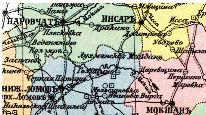
Рис. 5. Фрагмент карты Пензенской губернии 1913 г.

Майдана размещалось торгово-промышленное с. Голицыно Нижнеломовского уезда. На карте 1913 г. оно обозначено соответствующим условным знаком (рядом дан квадратик с точкой). Оба села были крупными – с числом жителей от 1000 до 5000, и находились в тесных хозяйственных и культурных отношениях. Этим и объясняется трансграничное состояние местности в исследуемый период. По состоянию на 1914 г. с. Лухменский Майдан (Вшивый Майдан) входило в состав Кириклейской волости Наровчатского уезда.