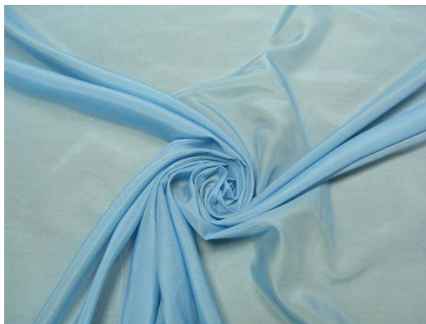
Рис. 1. Шелк или батист.

или рогожка. Нитки используют шелковые или металлик: белого, золотого, серебряного, голубого цвета и др. Для декора берут разные декоративные материалы.