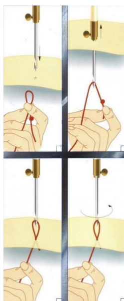
Рис. 3. Тамбурный шов люневильским крючком.