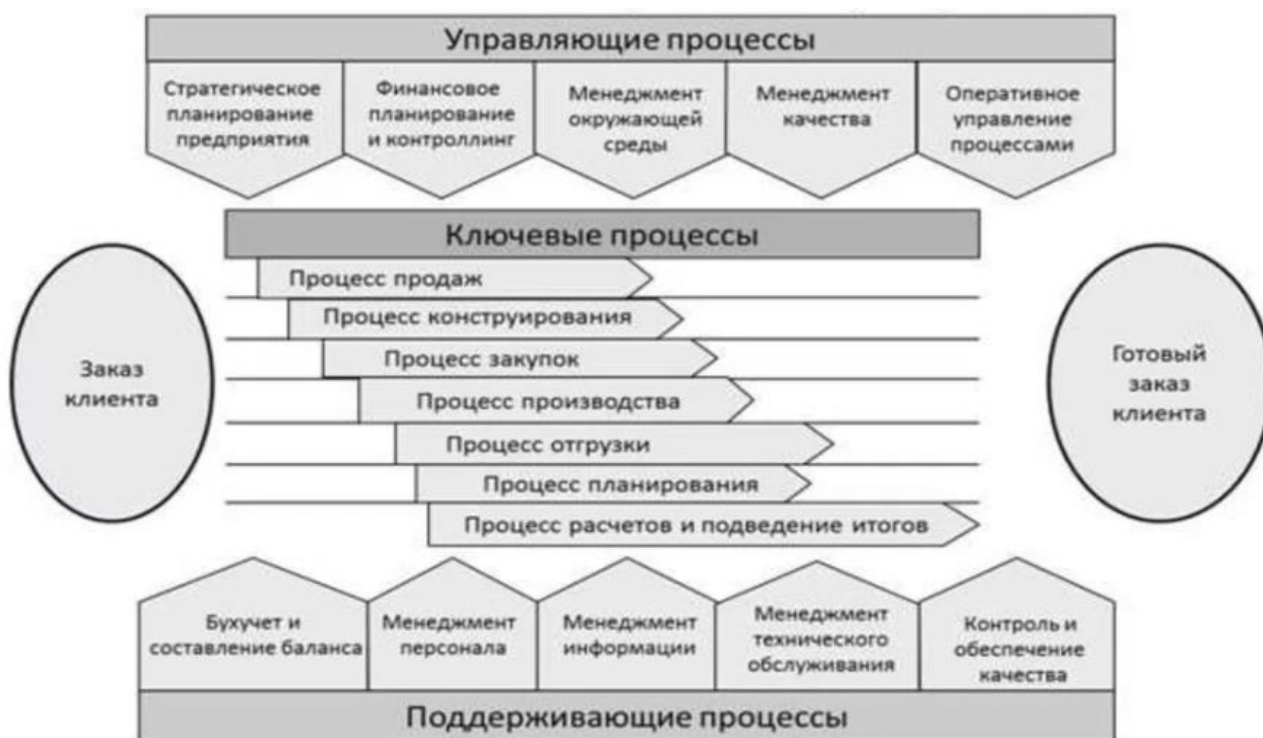
Рис. 2. Пример схемы бизнес-процессов организации.

Модельные решения, принятые в отношении каждого элемента архитектуры бизнес-процесса, в совокупности позволяют получить целостное представление о каждом из продуктовых бизнес направлений с учетом всех возможных измерений. Важно всегда поддерживать архитектуру в актуальном состоянии [4].