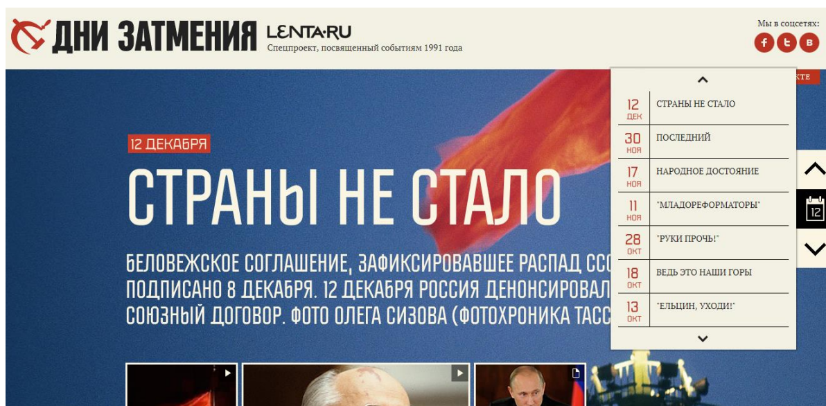
Рис. 1. Лонгрид «Дни затмения» [15].

оформления разных разделов лонгрида и переходов между ними способствуют формированию единого дискурса.