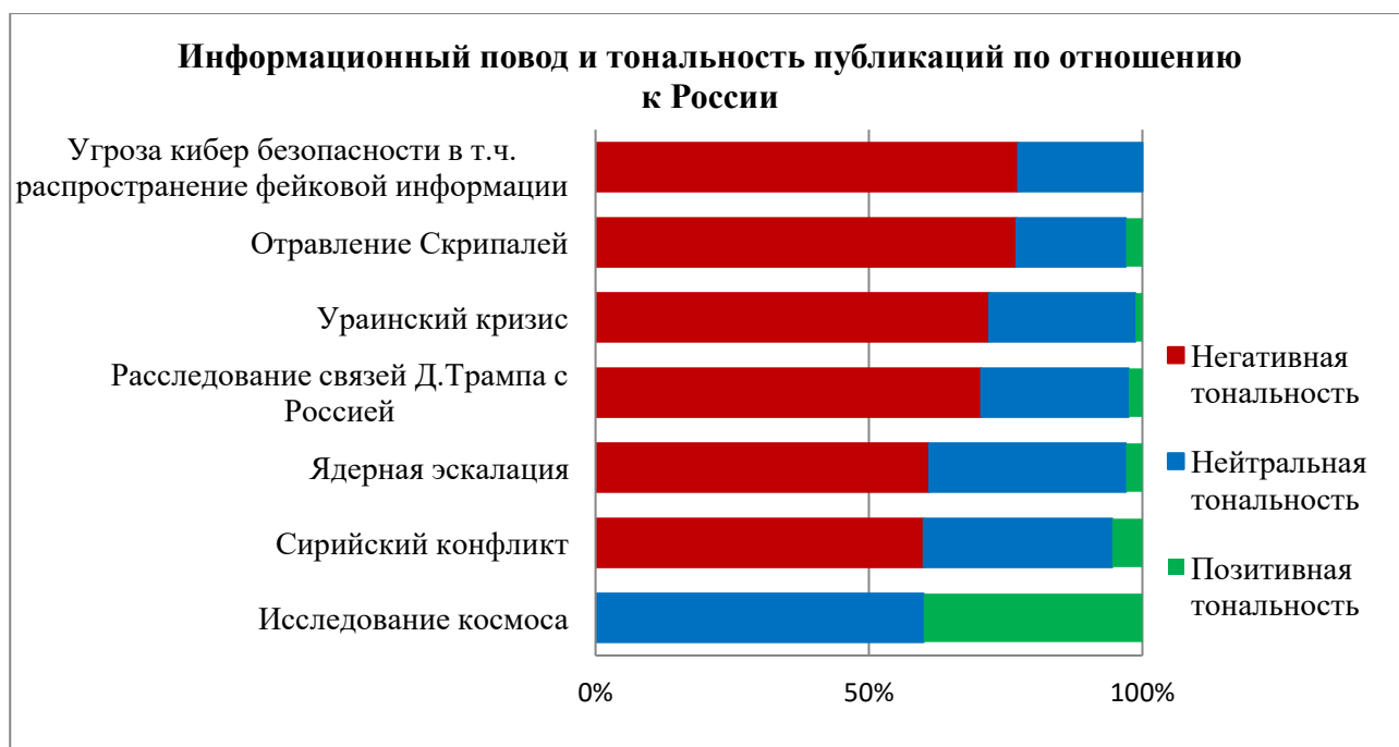
Рис. 1. Распределение публицистических материалов по тональностям (The Guardian, The Observer) за период 2017-2018 гг.

Необходимо подчеркнуть, что по меньшей мере 60% статей каждой отдельно взятой политической темы, освещаемой британскими СМИ, являются негативными, что указывает на высокую степень напряженности информационной обстановки по отношению к России в настоящее время (см. рис. 1).