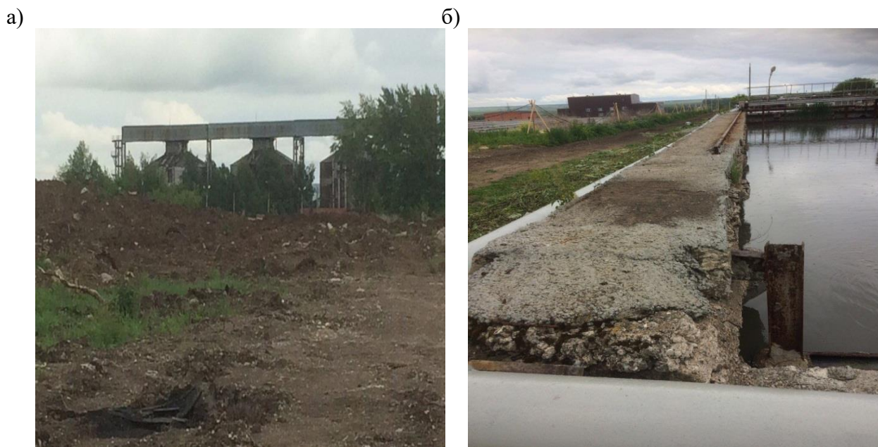
Рис. 1. Резервуары (а) и отстойники (б) для хранения воды.

(Ичалковский район и п. Николаевка) и сточных вод (г. Саранск). Исследуемую воду предварительно очищали от крупных примесей с помощью бумажного фильтра и проводили химический анализ состава (табл. 1).