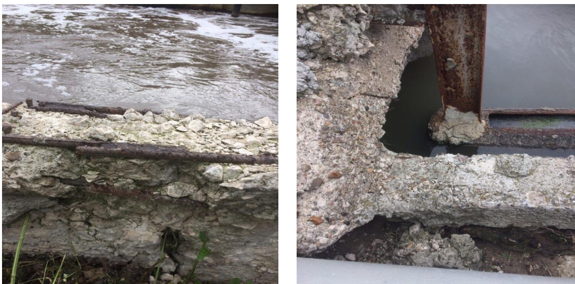
Рис. 2. Воздействие агрессивной среды на железобетонные конструкции (разрушение бетона и коррозия арматуры).

месторождения республики Мордовия (10, 20 и 30%). Природные цеолиты – новый тип полезных ископаемых, использование которых в промышленном и сельском хозяйстве началось только в 60-х годах прошлого столетия. Пористая микроструктура и другие особенности строения цеолитов определяют их уникальные адсорбционные катионообменные и каталитические свойства, обуславливающие их применение в промышленности, позволяя использовать их в качестве сорбентов для очищения воды [1]. Одновременно добавка цеолитсодержащих пород к цементным составам не только активизирует процесс твердения, но и улучшает микроструктуру, что приводит к увеличению прочности, коррозионной стойкости и непроницаемости цементного камня [2].