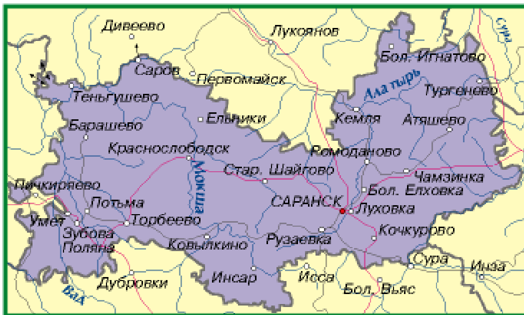
Рис. 1. Территория Республики Мордовии.

степени активизировавшееся на фоне реалий современной политической и экономической обстановки, выезд для городских жителей страны на выходные за пределы своих населенных пунктов становится одним из элементов стиля жизни. Данное направление является перспективным не только для местных жителей, но и гостей республики.