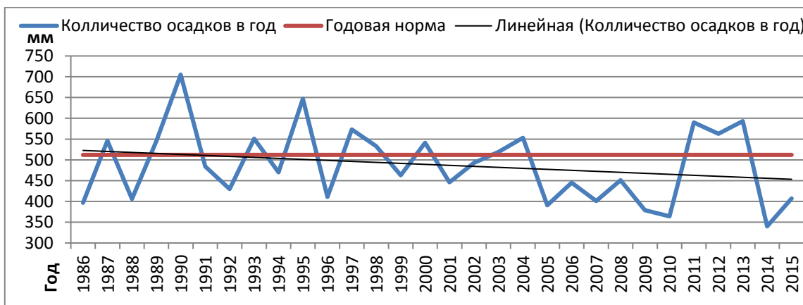
Рис. 1. Среднегодовое количество осадков по МС Саранск за 1986–2015 гг.

В соответствии с колебаниями условий атмосферной циркуляции осадки выпадают в течение года неравномерно, имеет место чередование дождливых и сухих периодов различной продолжительности. Дождливым считается период, в течение которого осадки выпадают ежедневно или с перерывами не более чем на 1 день, а их суточная сумма составляет более 1 мм.