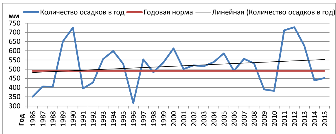
Рис. 3. Среднегодовое количество осадков по МС Б. Берзники за 1986–2015 гг.

На МС Темников, судя по тренду (рис. 2), идет повышение годовой суммы осадков. Максимальное количество осадков выпало в 1998 г (761 мм), а минимальное, так же, как и в Саранске – в 2014 г. (358 мм).