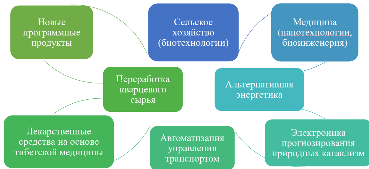
Рис. 1. Приоритетные направления развития проектов.

В Республике Бурятия существует ряд приоритетных направлений реализации инновационных проектов в различных отраслях (рис. 1) [6]: