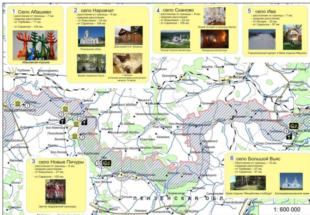
Рис.1. Приграничные населенные пункты Пензенской области, представляющие интерес для Мордовии.

Село Абашево Спасского района Пензенской области находится на границе с Торбеевским районом Республики Мордовии. Расстояние от границы – 7 км, среднее расстояние от Торбеево – 17 км, от Саранска – 124 км. Это старинное русское поселение прославилось игрушками из глины абашевских мастеров (свистульки, изображающие животных, головы козлов, оленей, баранов, увенчанных изогнутыми, иногда многоярусными рогами). В настоящее время в селе действует творческая лаборатория закрытого акционерного общества «Абашевская керамика», на базе которой ведется обучение детей гончарному ремеслу (лепке глиняной игрушки,) а также действует современное производство традиционной абашевской игрушки.