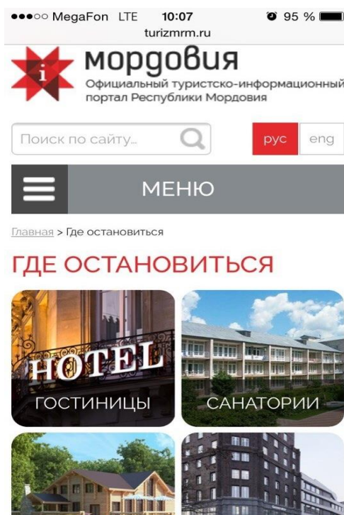
Рис. 3. Мобильная версия туристско-информационного портала Республики Мордовия [4].

Сайт обладает современным дизайном, отвечающим требованиям, предъявляемым к оформлению информационных туристских порталов: логичная структура разделов, простота навигации, удобство использования разными (по степени подготовленности) категориями пользователей. Сайт оформлен в соответствии с основным стилем туристского продукта Мордовии с применением преобладающего красного, серого, белого цветов и национального мордовского узора.