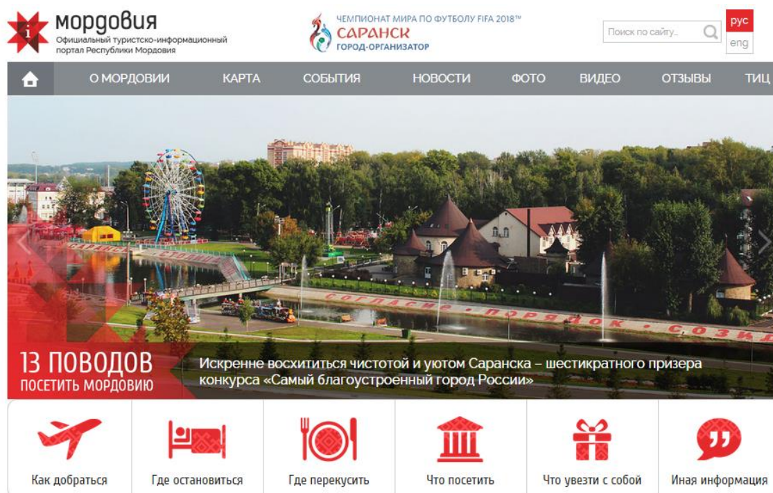
Рис. 1. Меню главной страницы туристско-информационного портала Республики Мордовия [4].

Сайт состоит из 14 основных разделов. На его страницах размещена информация об экскурсионных маршрутах, театрах, музеях, архитектурных памятниках, средствах размещения, транспорте, предприятиях питания, значимых событиях, объектах природы, спорта, религии и т. д. В качестве основного визуального элемента используется слайдер, демонстрирующий 13 поводов посетить регион № 13. Основное меню ресурса предлагает посетителям ответы на традиционные вопросы туристов: «Как добраться», «Где остановиться», «Где перекусить», «Что посетить» и «Что увезти с собой» (см. рис. 1).