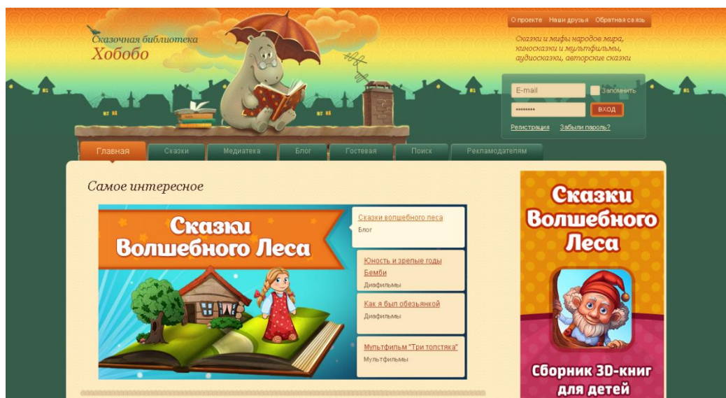
Рис. 5. Скриншот главной страницы сайта сказочной библиотеки «Хобобо».

Сказочная библиотека «Хобобо» (hobobo.ru). Сказочная библиотека «Хобобо» – это крупнейший в русскоязычном Интернете проект. В библиотеке представлена богатая коллекция детских сказок (более 6 тыс. сказок 154 стран мира, сказки классиков, диафильмы и богатейшая коллекция аудиосказок и мультфильмов). Сказки можно прочесть как на сайте, так и при необходимости скачать в формате txt и в формате FB2. Сайт библиотеки Хобобо был создан в 2010 году. В 2011 году сайт стал лауреатом всероссийского конкурса сайтов для детей и подростков «Позитивный контент-2011» и получил премию в номинации «Лучший детский сайт» (рис. 5). Посетители данной библиотеки – это преимущественно молодые семьи и мамы с детьми (70%), педагоги (20%), дети и все любители сказочной тематики (10%). Контент сайта используют родители для образования детей, для обучения в детских садах и дошкольных центрах. Сайт сказочной библиотеки «Хобобо» включен в рекомендательные списки педагогических центров и даже в системы дистанционного образования для детей [4].