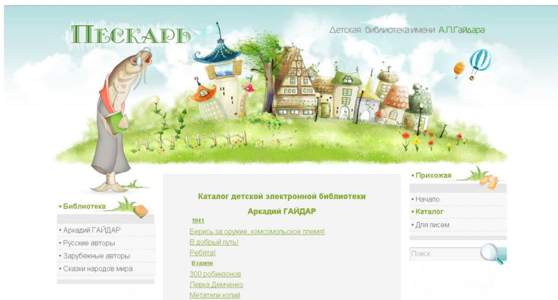
Рис. 4. Скриншот главной страницы сайта детской электронной библиотеки «Пескарь».

Виртуальная библиотека «Пескарь» (peskarlib.ru) – проект Детской библиотеки им. А. П. Гайдара В данной виртуальной библиотеке собраны рассказы и сказки для детей русских и зарубежных писателей, а также сказки народов мира. У библиотеки простой интерфейс и хорошее графическое оформление (рис. 4). Произведения можно читать прямо на сайте, либо распечатать или скопировать текст на компьютер.