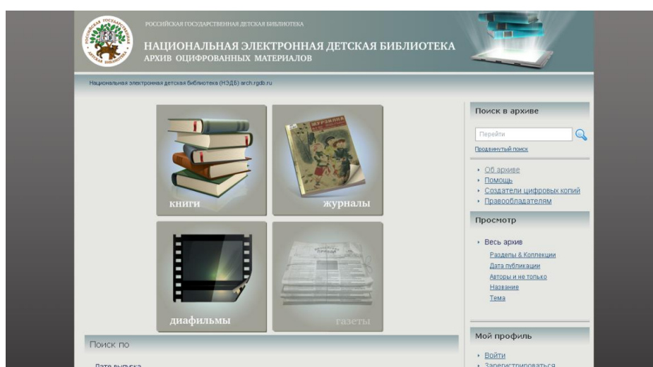
Рис. 1. Скриншот главной страницы сайта Национальной электронной детской библиотеки.

Национальная электронная детская библиотека (НЭДБ) – архив оцифрованных материалов (arch.rgdb.ru). НЭДБ создана Российской государственной библиотекой в 2012 году. В коллекции данной библиотеки представлены наиболее значимые произведения для детей и книги, вошедшие в круг детского чтения, оформленные лучшими отечественными художниками-иллюстраторами, а также книги, являющиеся ярким отражением исторических, политических, культурологических, художественных и педагогических процессов, происходивших в нашей стране в различные исторические периоды. Представлены оцифрованные копии книг, журналов, диафильмов и газет (рис. 1). Для удобства пользователей НЭДБ оснащена самыми современными техническими средствами. Понятный интерфейс позволяет реализовать широкие возможности просмотра электронных документов с их максимальным разрешением. Доступ к базе данных НЭДБ для пользователей сети Интернет осуществляется в соответствии с действующим законодательством об авторском праве [3].