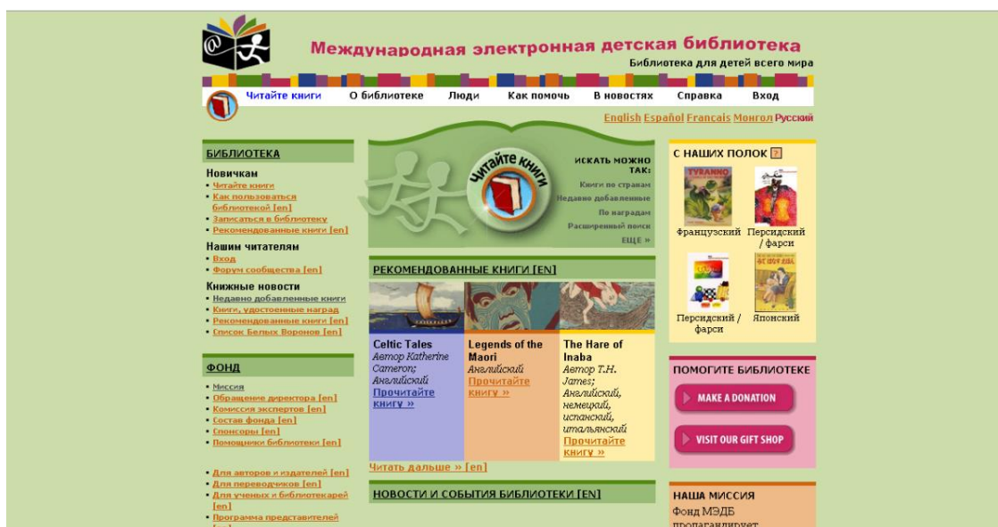
Рис. 2. Скриншот главной страницы сайта Международной электронной детской библиотеки.

Международная электронная детская библиотека ( ru.childrenslibrary.org ). Миссия Фонда Международной электронной детской библиотеки (Фонда МЭДБ) состоит в поддержке детей всего мира стать полезными членами глобального сообщества – проявляющими толерантность и уважение к различным культурам, языкам и идеям – через возможность бесплатно читать онлайн лучшую детскую литературу. Фонд реализует свое видение путем создания электронной библиотеки выдающихся детских книг со всего мира и поддержки сообществ детей и взрослых, направленных на исследование и использование этой литературы посредством инновационных технологий, созданных в тесном содружестве с детьми для детей [2]. На сайте библиотеки представлены оцифрованные копии книг разных стран на языке оригинала (рис. 2).