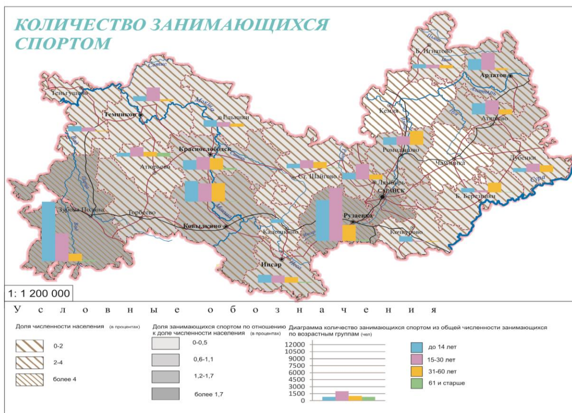
Рис. 3 – Количество занимающихся спортом по территории в РМ

Важным показателем уровня развития физической культуры и спорта является количество занимающихся. Так, общее число посещающих секции по видам спорта, клубы и группы физкультурно-оздоровительной направленности в 2012 г. составило более 188 тыс. чел. По сравнению с 1998 г. этот показатель увеличился более чем на 50 %. Это результат эффективности проводимой в последние годы политики развития спорта и физической культуры в Мордовии. На рисунке 3 отражено количество занимающихся спортом на территории Республики Мордовия.