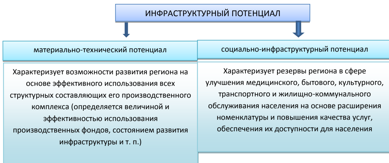
Рис. 2. Виды инфраструктурного потенциала

Несмотря на вышеназванное свойство полиструктурности инфраструктуры, сам ИП удобнее изучать с позиции разделения на 2 составляющие: материально-технический потенциал и социально-инфраструктурный (рис. 2).