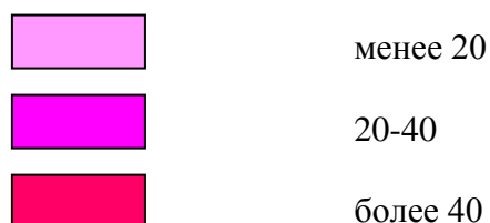
Рис. 4. Обеспеченность населения г. Саранск банковскими организациями, количество объектов [составлено автором: по ист.: 1, 2]