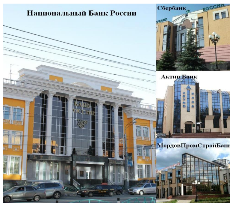
Рис. 3. Национальный Банк России, Сбербанк, Актив Банк, МордовПромСтройБанк

В последние годы в г. Саранске интенсивно развивается строительство новых объектов, увеличиваются финансовые потоки, которые обеспечивают банковские организации. Они непосредственно участвуют в кредитовании организаций и обеспечивают перечисление денежных сумм. Соответственно в этот период времени количество банковских организаций заметно увеличилось, т. к. каждый банк может предложить организациям, участвующим в строительстве, более выгодные процентные ставки. Офисные здания крупных банков имеют достаточно презентабельный вид. На рисунке 3 представлены одни из самых востребованных банковских организаций г. Саранска.