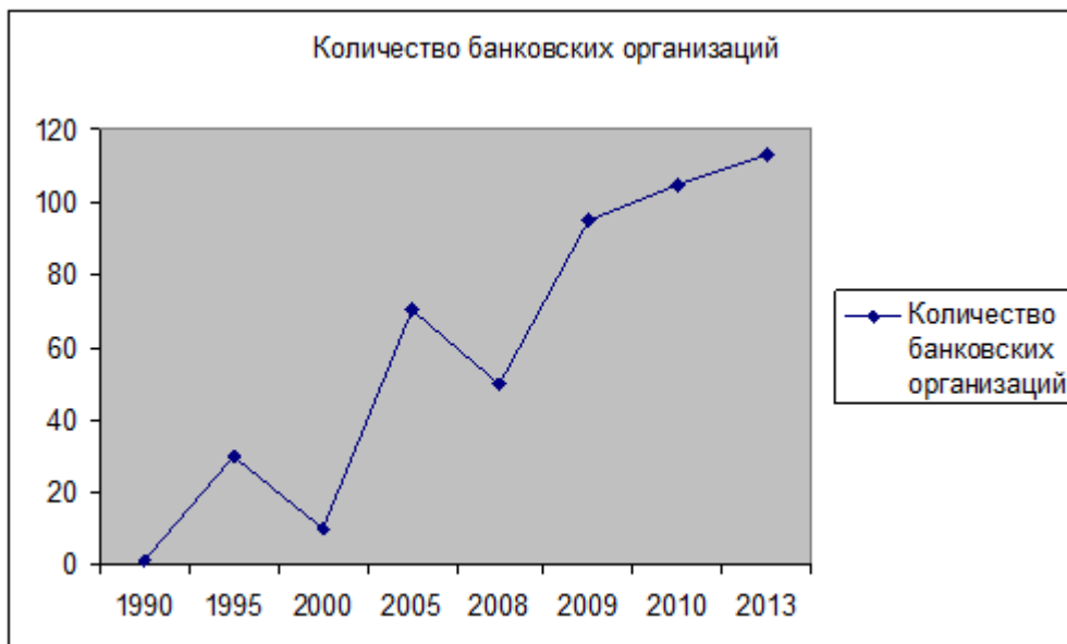
Рис. 1. Количество банковских организаций в период с 1990 по 2013 гг. [составлено автором]

Следующий банковский кризис случился в 2008 г. (рис. 1). Признаки кризиса проявились в снижении капитала ряда банков, падении прибыли, росте убытков, оттоке вкладов. Прекратили свою работу и многие банковские организации.